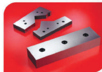
Плоские ножи для резки металла