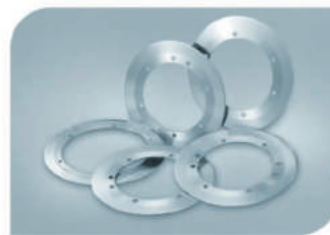
Дисковые и тарельчатые ножи