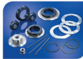
Держатели для дисковых и тарельчатых ножей