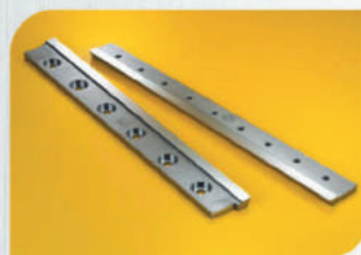
Ножи для пакетоделательных машин