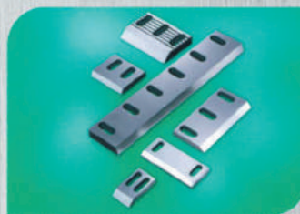
Ножи для дробилки