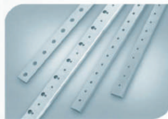
Подвижные ножи для резки бумаги