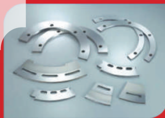
Секторные ножи (просечные)