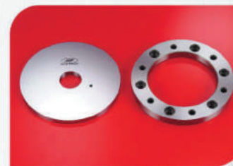
Дисковые ножи для резки металла